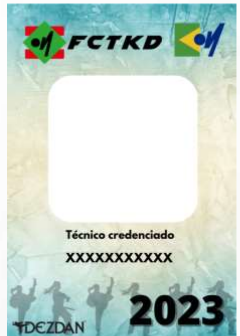
Figura 3: credencial de técnico