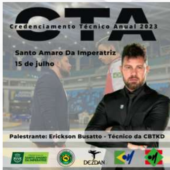
Figura 1: cartaz