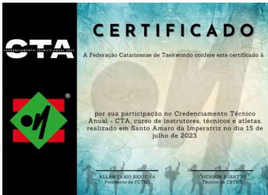
Figura 2: certificado do CTA